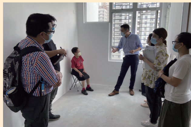
團隊與受惠者到新居視察。 The service team visits the new unit of the beneficiary.